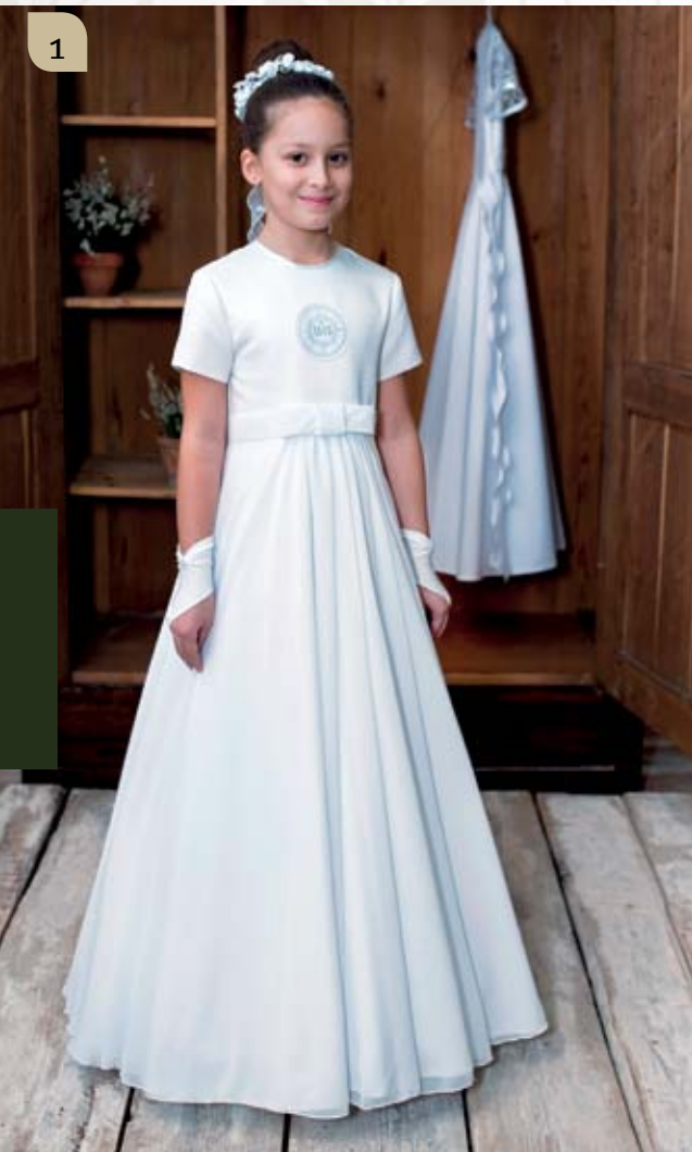
1 Sukienka wykonana z satyny i muślinu