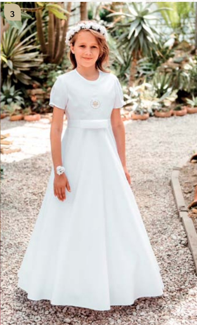
3 Sukienka z halką