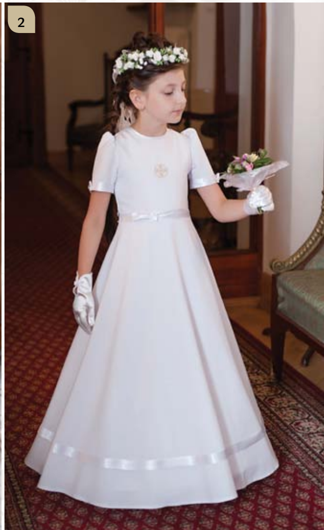
2 Sukienka z halką