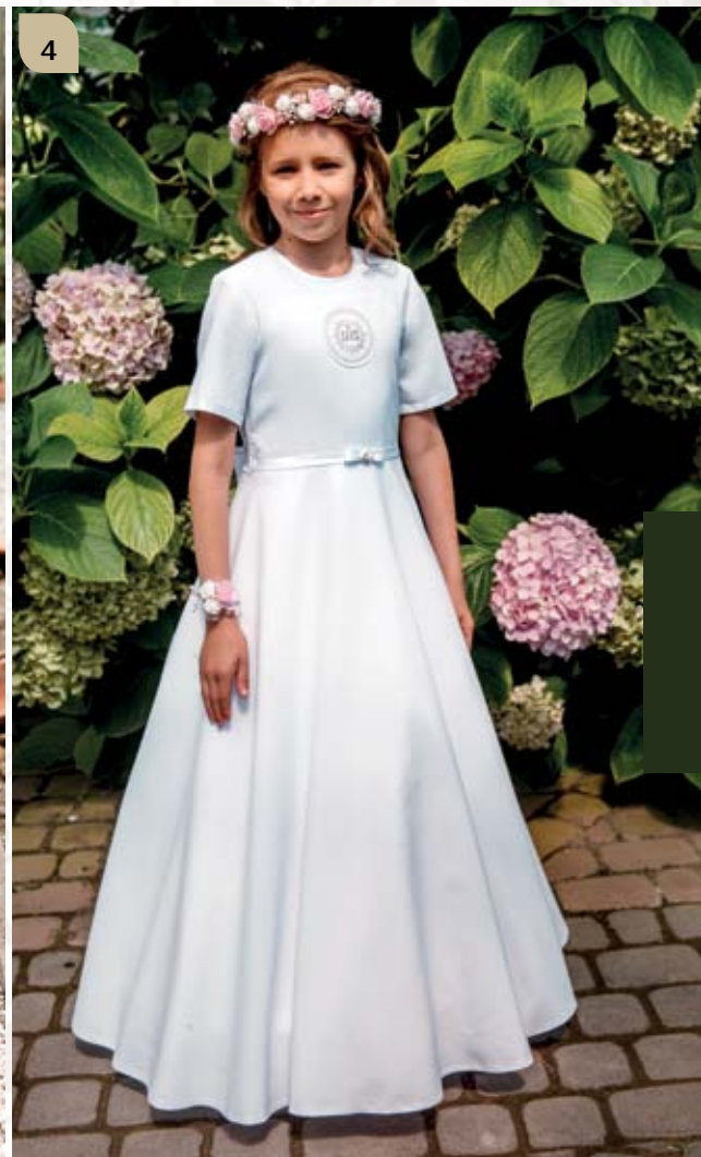
4 Sukienka z halką